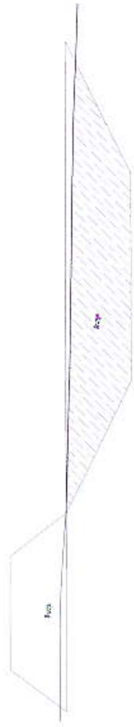
รูปตัด sta 0+500