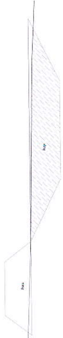
รูปตัด sta 0+300