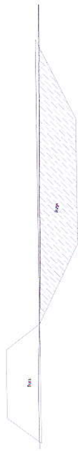
รูปตัด sta 0+400