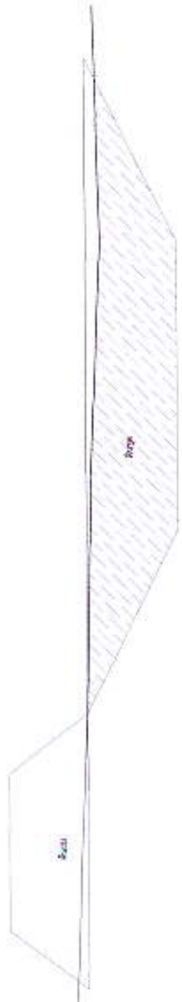
รูปตัด sta 0+600